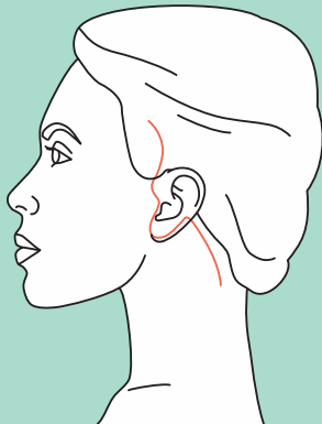
Narbenverlauf nach dem Facelift

Jede Operation bringt Risiken mit sich. Die Risiken eines Facelifts können aber minimiert werden, wenn die Operation von einem qualifizierten Plastischen Chirurgen mit genügend Erfahrung vorgenommen wird. Trotz größter Sorgfalt können aber, wie bei jedem chirurgischen Eingriff, während oder nach der Operation vereinzelt Komplikationen auftreten.