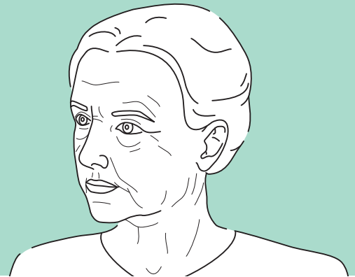
Zustand vor dem Facelift

Durch das Facelift ist keine Straffung der feinen Fältchen um Mund und Augenlider zu erwarten. Wenn sie diese als störend empfinden, müssen hier andere Methoden, wie zum Beispiel die Hautabschleifung (Dermabrasion) oder ein chemisches Peeling eingesetzt werden.