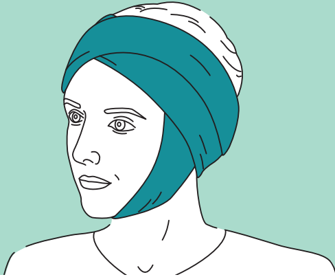
Kopfverband nach dem Facelift